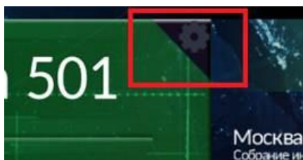
Рис 1. Кнопка настроек.

Для перехода в настройки приложения необходимо нажать кнопку настроек.