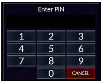
Рис 2. Окно ввода пин кода

Далее необходимо ввести пин код устройства – 5555